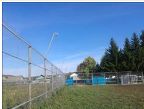
Освещение спортплощадки Проведено освещение на спортивной площадке

Мероприятие: Внутреннее ограждение памятников участникам Великой отечественной войны и замена в задней стороне стеку-рабицы на профнастил.