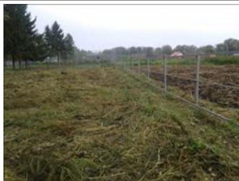
До ограждения Задняя сторона парка до ограждения

Мероприятие: Внутреннее ограждение памятников участникам Великой отечественной войны и замена в задней стороне стеку-рабицы на профнастил.