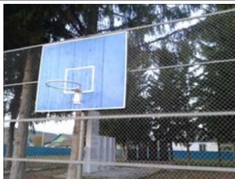
Баскетбольный щит Изготовлен и установлен баскетбольный щит