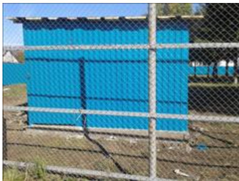
Будка Будка для скважины и хранения инвентаря и оборудования

Мероприятие: Тренировочные игры по футболу, волейболу, баскетболу