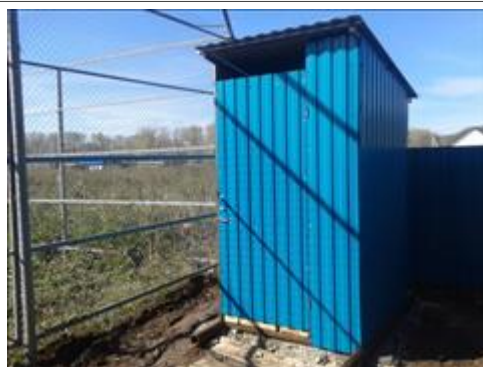
Туалет Установлен туалет в общественном месте.