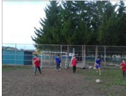
Соревнования Соревнование по мини футболу между уличными командами

Мероприятие: Проведение соревнований по мини футболу между уличными командами села Юлуково