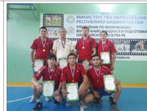
Сборная Сборная команда по волейболу с. Юлуково заняла второе место на районных соревнованиях. 11 октября 2018 г.