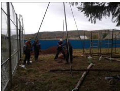
Бурение Бурение скважины для заливки льда