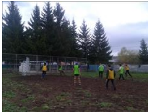
Футбол Тренировочные игры по мини футболу.