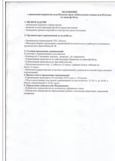
Положение 2 Положение о проведении первенства села Юлуково среди любительских команд села Юлуково по мини-футболу.