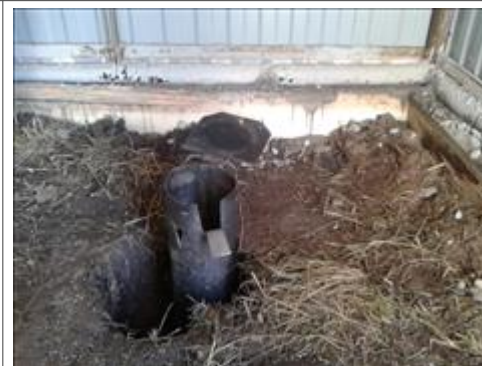
Скважина Подготовка установке станции для заливки льда