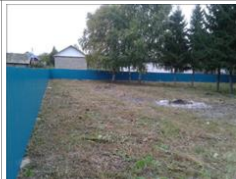
После ограждения Задняя сторона парка после ограждения

Мероприятие: Бурение скважины и установка станции для заливки льда