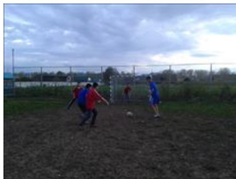
Футбол1 Тренировочные игры по мини футболу, учащиеся.