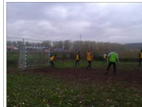
Футбол2 Тренировочные игры по футболу, сентябрь